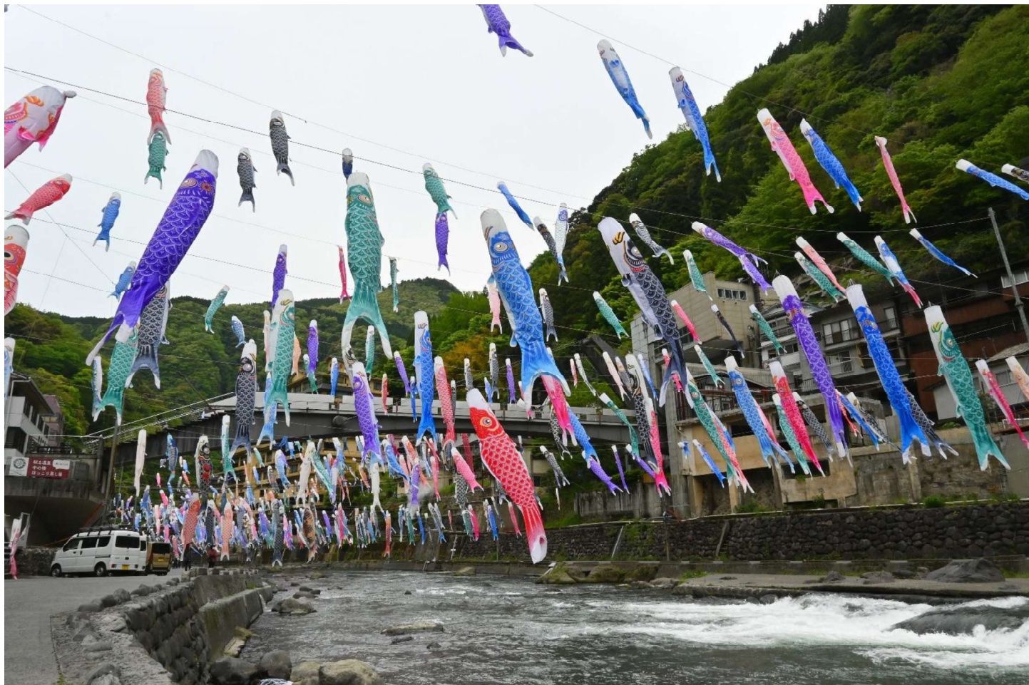
杖立温泉(阿蘇郡小国町)