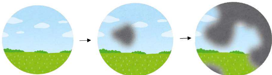
緑内障の視野 (症状の進行)

40歳以上の約20人に1人は緑内障と考えられていますので、決して珍しい病気ではありません。しかし、緑内障の初期では症状に気がつくことはほとんどありません。いったん欠けてしまった視野が元に戻ることはありません。できるだけ早期に緑内障を発見し、点眼薬などにより眼圧を下げることによって、緑内障が進行しにくくすることが大切です。