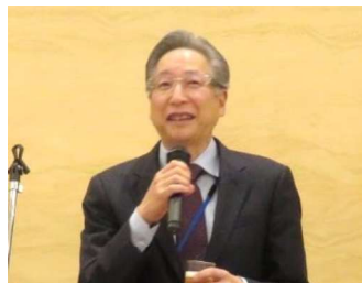
八代市医師会西会長