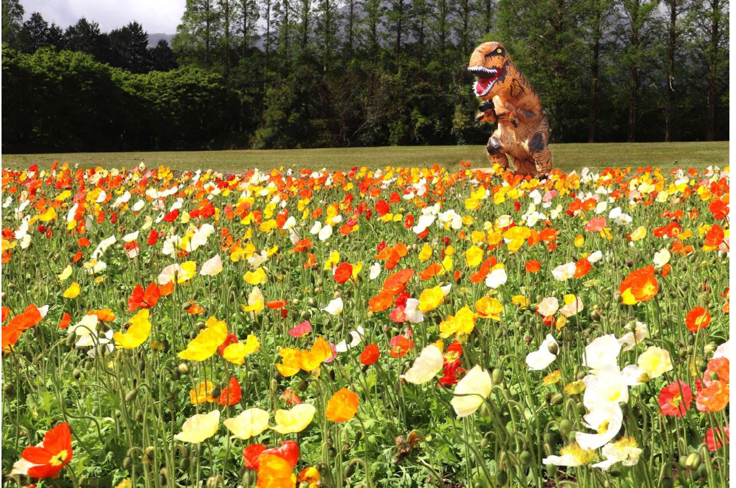
生駒高原(宮崎県 小林市) 八代白百合学園高等学校 写真部