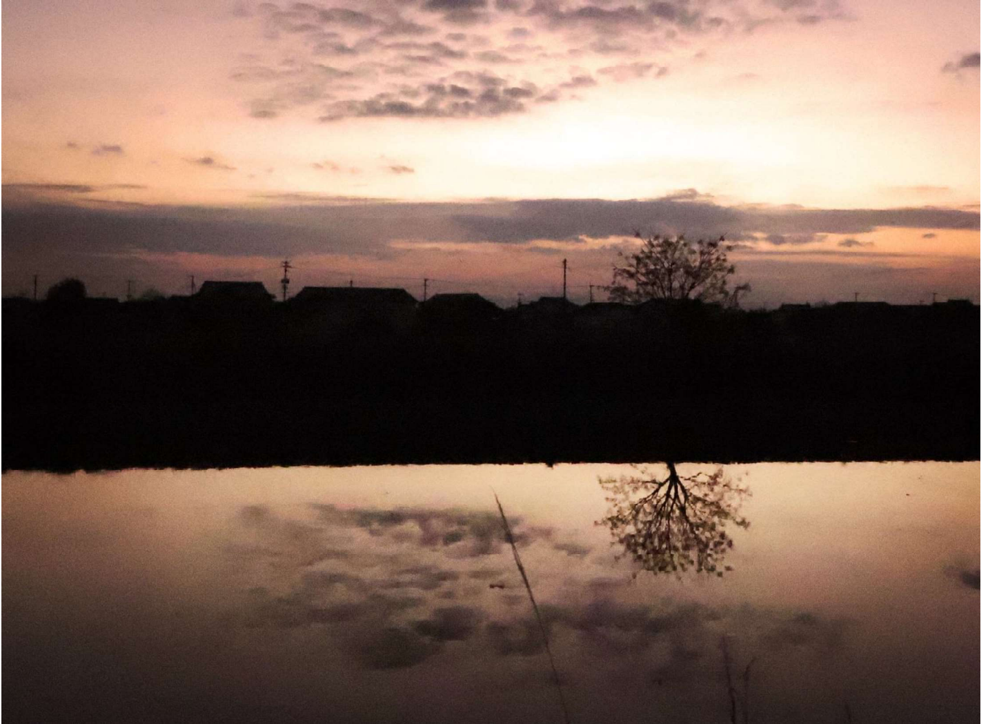
千丁(八代市) 八代白百合学園高等学校 写真部