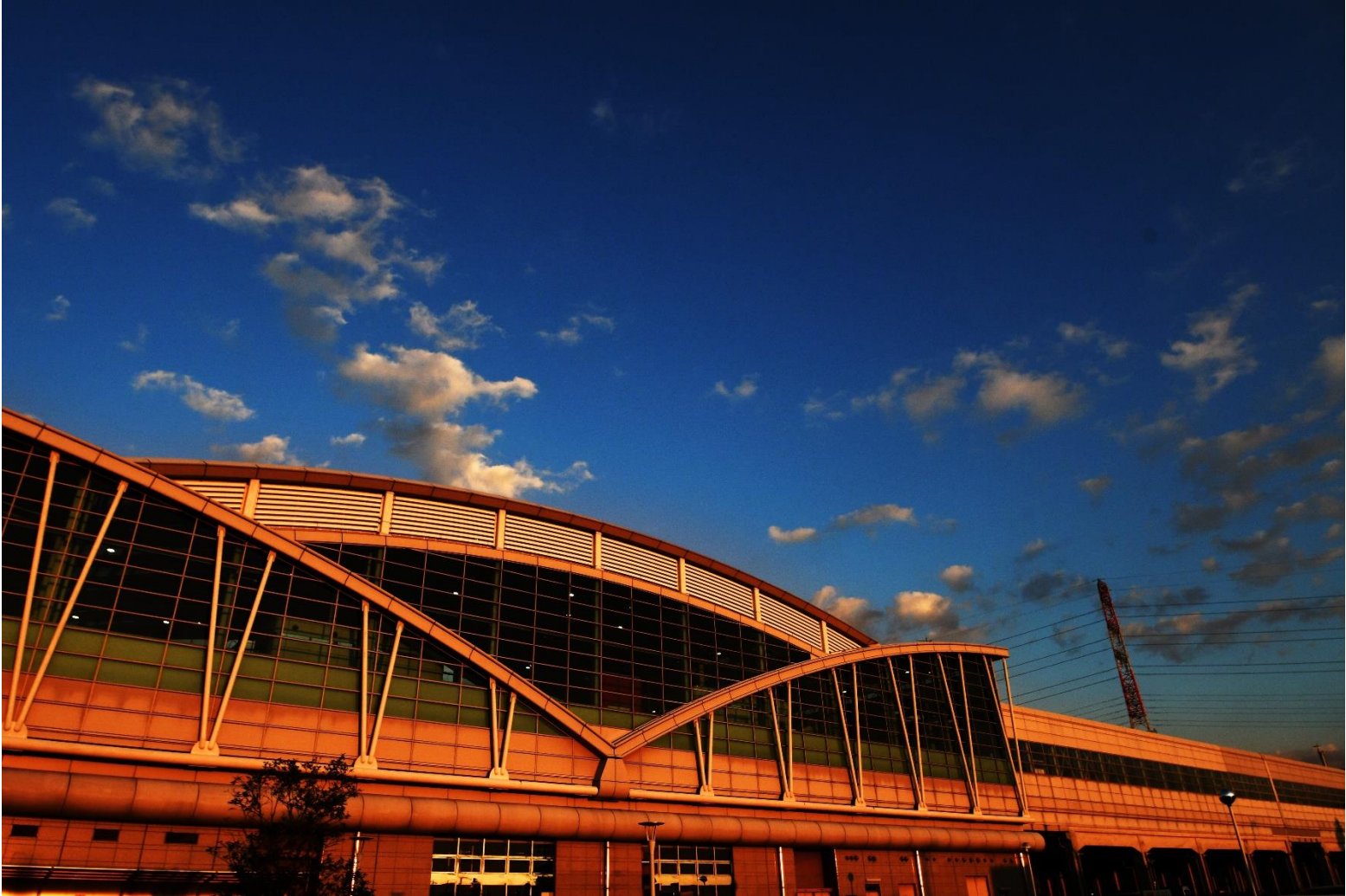
(新八代駅) 八代白百合学園高等学校 写真部