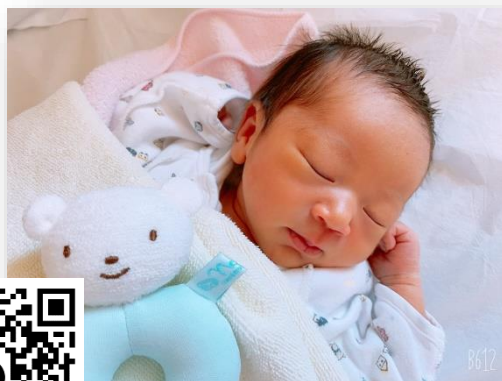
ゆい(熊本労災病院産婦人科通信)