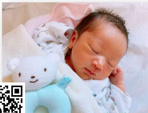
ゆい(熊本労災病院産婦人科通信)