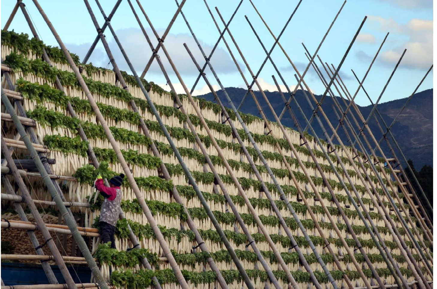
撮影場所：宮崎市田野町 八代白百合学園高等学校 写真部