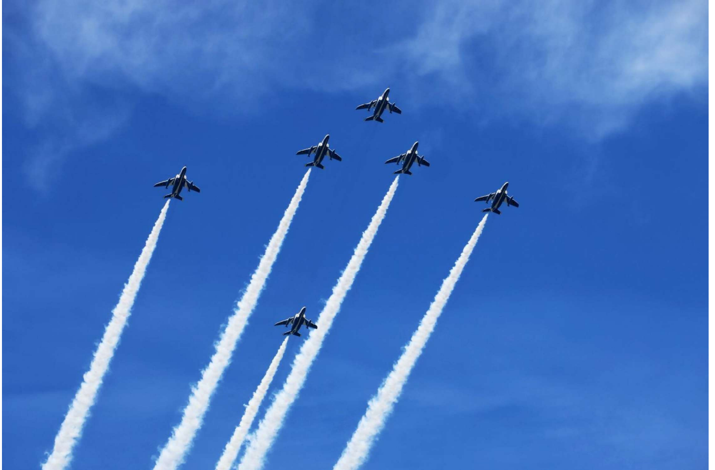
撮影場所：長崎市（長崎県） 八代白百合学園高等学校 写真部